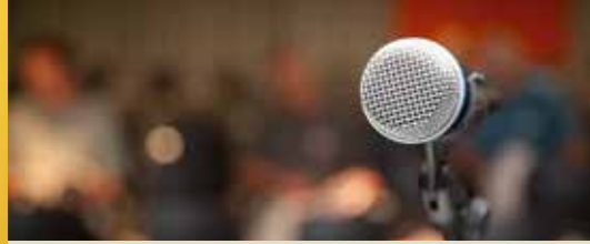
Waarom geen debat over het meerjarenplan? (p. 2)