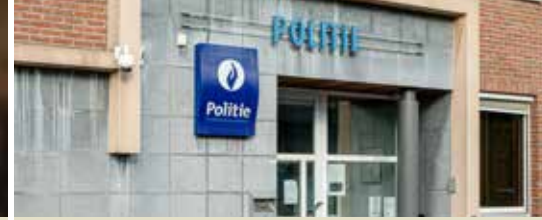
Meer veiligheid met een efficiënte politie (p. 3)