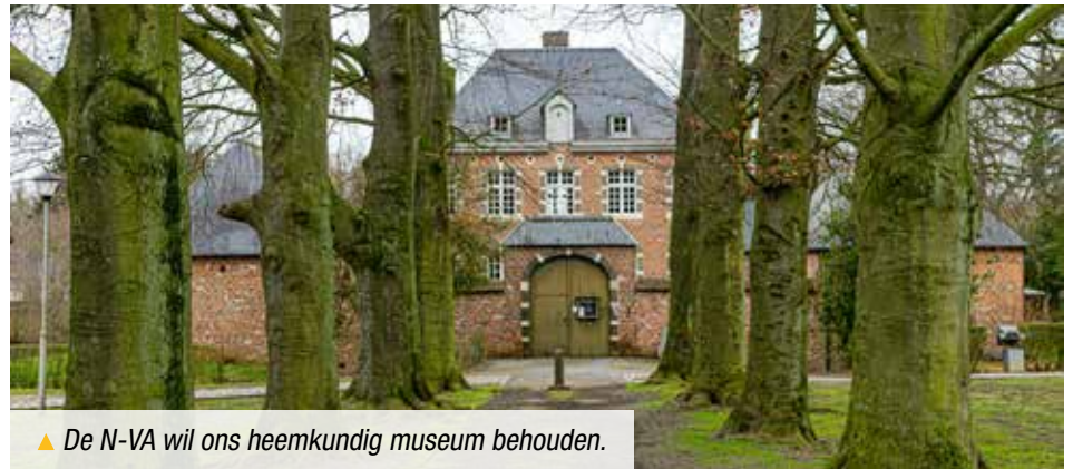
▲ De N-VA wil ons heemkundig museum behouden.

De meerderheid besliste op de gemeenteraad van januari om de overeenkomst met de Heemkundige Kring Zolder voor het gebruik van het Woutershof op te zeggen. Daarmee valt het doek over het heemkundig museum tegen eind 2021.