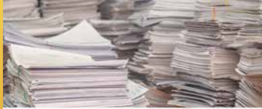
Gemeente verprutst Zolderse investeringsdossiers (p. 3)