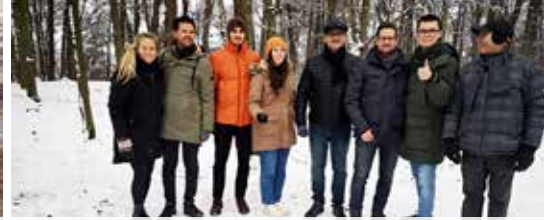
Heusden-Zolder in beeld (p. 5)